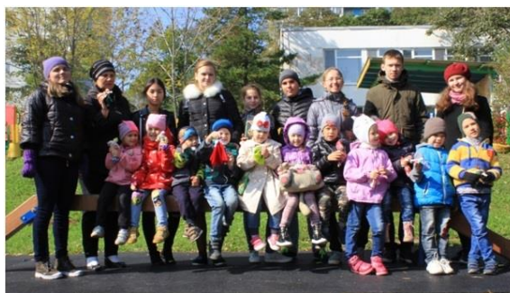
Рис.3 Участники проекта «Народные забавы»

Педагогическая ценность встречи педагога с детьми ещё и в том, что это случилось всего 12 занятий. А для диагностики полученного образовательного результата мною разработан кроссворд (рис. 4). Как правило, результат его заполнения на первом вводном занятии – плачевный. Обращаю внимание детей на это. И возвращаюсь к нему на самом последнем занятии. Результат - налицо! Он быстро и лихо заполняется, вызывая всеобщую радость! А все правильно отгаданные ответы выделяют его ключевой смысл в раскрывшемся главном ответе – СЛАВЯНЕ. Народная кукла – мудрость народа! Давайте узнаем о ней больше! Эта мысль, которую я хочу передать детям.