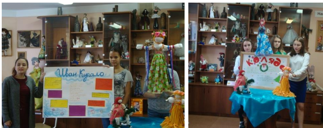
Рис.7 - 8 Семинар «Русские праздники и традиции»

В другой смене, после изучения русских традиций, размышляя над идеей и проблемой будущего проекта, ребята обратили внимание на то, что дети знают лишь один русский народный праздник с участием кукол, это, конечно же, - «Масленица»! А ведь исконно на Руси практически к каждому празднику делали кукол, которые или дарились, или служили для его оформления. Заинтересовала ребят кукла «Купавка», которая делается к дню Ивана Купалы, кукла «Коляда», с которой колядуют в Рождество, весенние «мартинички» и другие. (Рис.7 – 8)