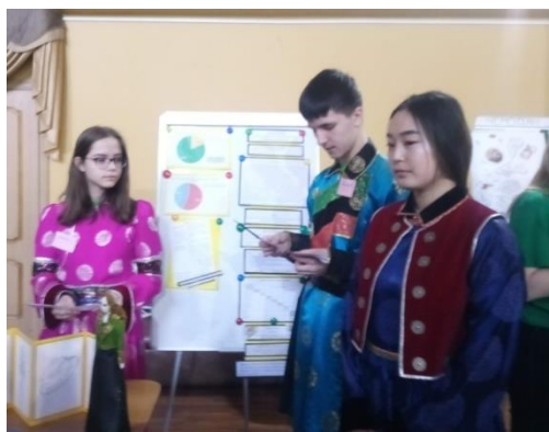
Рис.6 Участники проекта «Снова в тренде» на защите своего проекта

детей девочка из Бурятии, но остальные участники - русские ребята, которые тоже обеспокоились положением национальной культуры Бурятии и с удовольствием изучали историю и традиции бурятской культуры, рисовали эскизы современной молодёжной одежды, выставляли свои заметки в социальные сети, привлекая подписчиков. (Рис.6) Трудно описать чувство гордости, которое испытали юные проектировщики!