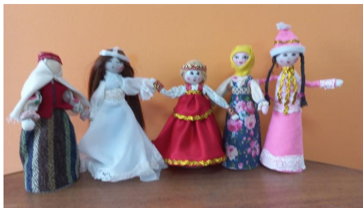
Рис.5 «Куклы в национальных костюмах»

В своей жизни мы постоянно впитываем, осваиваем обычаи и традиции своих соседей, в школе изучаем историю других народов, постигаем общность социально-исторического развития. Мы постигаем опыт межнационального общения в совместной деятельности и повседневных контактах. Это помогает преодолеть национальное самовозвеличивание, чувство национальной исключительности и ощутить великую духовную силу единого народа. В условиях современной глобализации некоторые национальные культуры поглощаются другими, с более глубокими традициями. Проблема сохранения и возрождения культурного наследия при этом становится особенно актуальна. Данная тема интересует не только взрослое население, но и школьников.