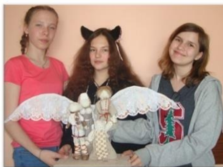
Рис. 2 Участники проекта «Крылья семьи»

А проект «Крылья семьи» занял 1 место на международном детском творческом конкурсе «Солнечный свет» в номинации «Декоративно-прикладное творчество». В нем ребята создали кукольную композицию в виде крестьянской древнерусской семьи и крыльев ангела-хранителя, которые олицетворяли важные семейные и жизненные ценности. Участники проекта сделали акцент на том, что темы семьи и Древней Руси неразделимы и актуальны всегда. Для педагога это важно, ведь вместе с куклой подростку легче проанализировать свои поступки, легче понять сложный мир, окружающий его в действительности, выразить свое отношение к нему.