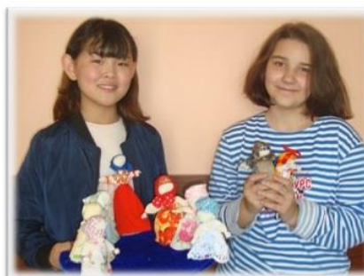
Рис.1 Участники проекта «Хоровод русских кукол»

Куклу на Руси считали живым существом – её нельзя было резать и колоть. Поэтому иголку и ножницы долгое время использовали только для изготовления одежды куклы, а сами куклы были «закрутками», ткань закручивали и завязывали нитками. А кто делал куклы на Руси, как они назывались, почему у кукол не было лица, что означает крест из красных ниток на лице? Анкетирование и опрос школьников показали, что лишь 8 % из опрошенных детей знают об этом. Именно поэтому было решено восполнить этот информационный пробел. Участники программы узнают ответы на эти вопросы на занятиях мастерской, знакомясь, таким образом, с бытом и традициями наших предков, с жизненным укладом народа, его мироощущениями и взаимоотношениями. Желание узнать об этом больше, побуждает к разработке проектов.